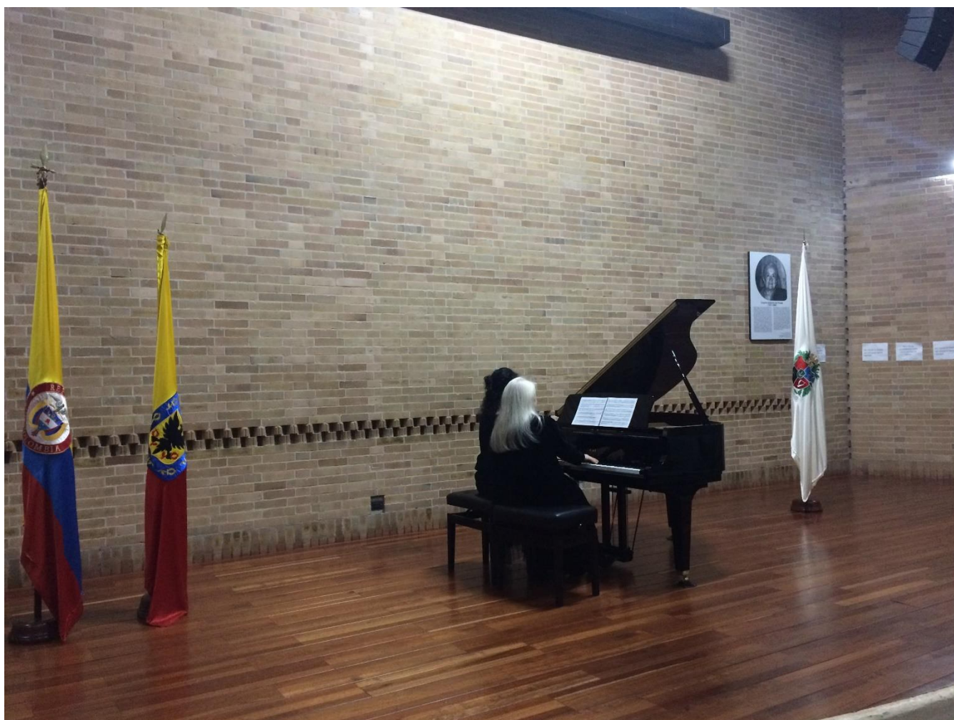
Ilustración 11 Concierto Sempre con Passione. Auditorio Virginia Gutierrez de Piñeres, Universidad Nacional de Colombia sede Bogotá

Auditorio Virginia Gutierrez de Piñeres, de la Facultad de Ciencias Sociales y Humanas de la Universidad Nacional de Colombia Sede Bogotá, en conmemoración de la vida de la maestra Luz Angela Posada (ver ilustración 11).