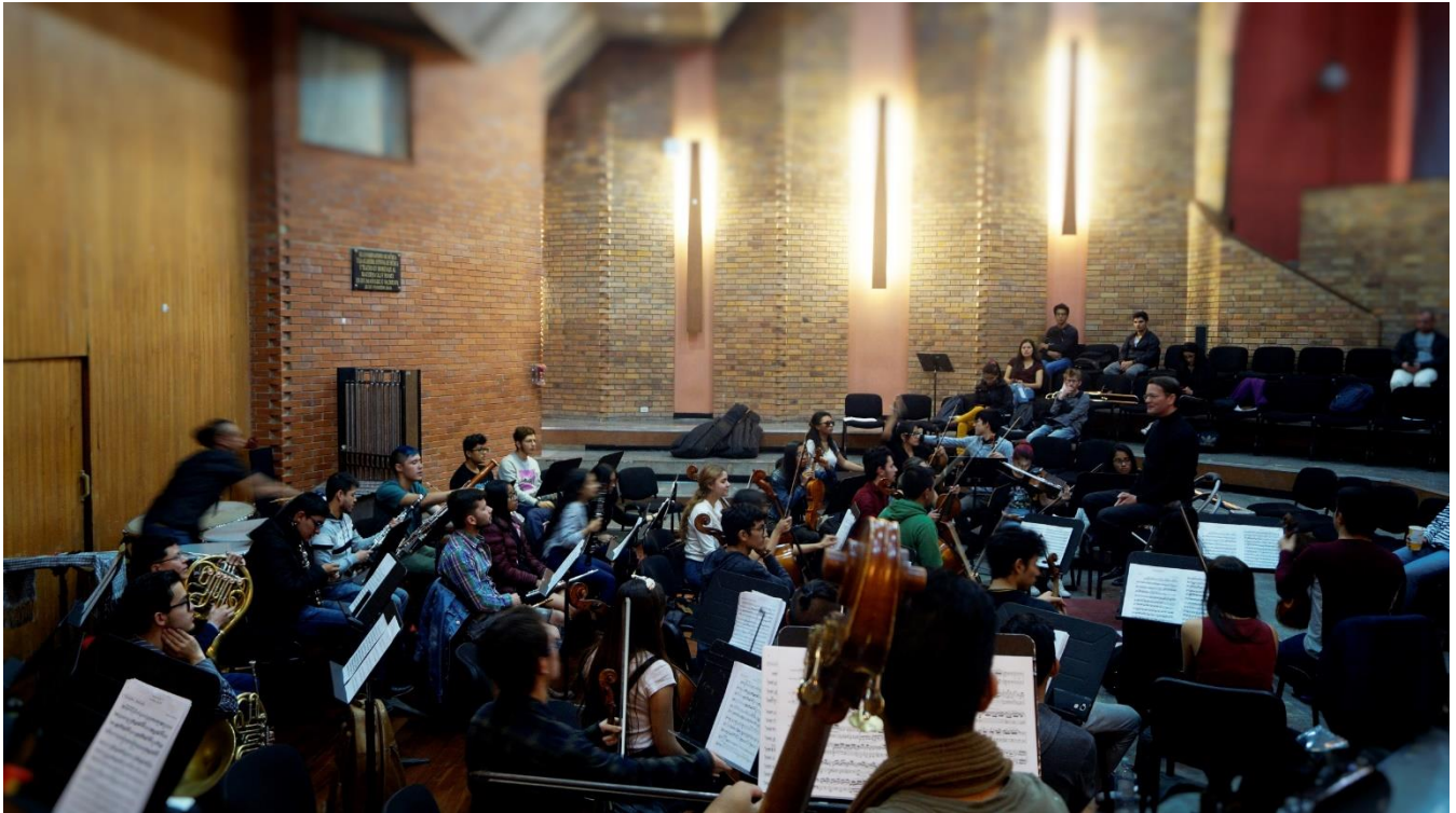
Ilustración 5 Ensayo abierto al Público. Auditorio Olav Roots Universidad Nacional de Colombia