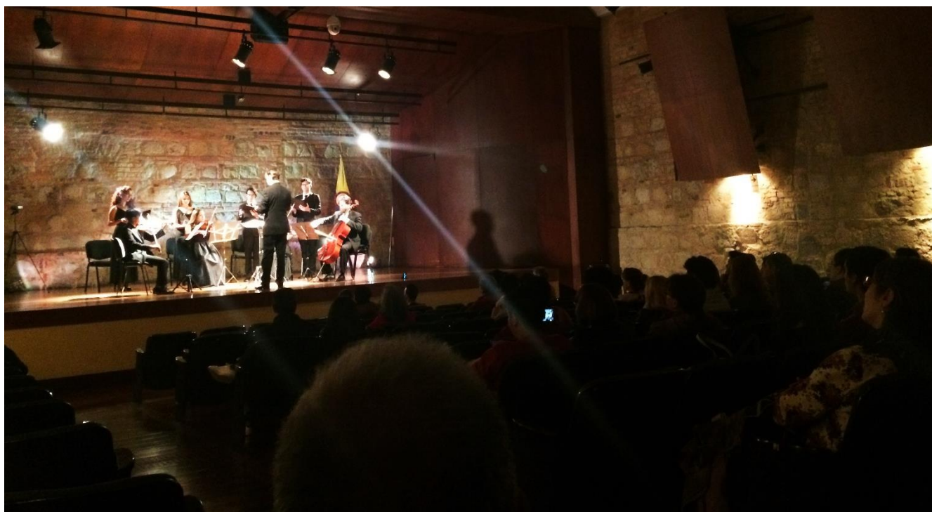
Ilustración 2 Concierto Auditorio Teresa Cuervo Borda. Enero 17 de 2019.

Back to Nature presenta: Concierto “La Messe de Notre Dame”