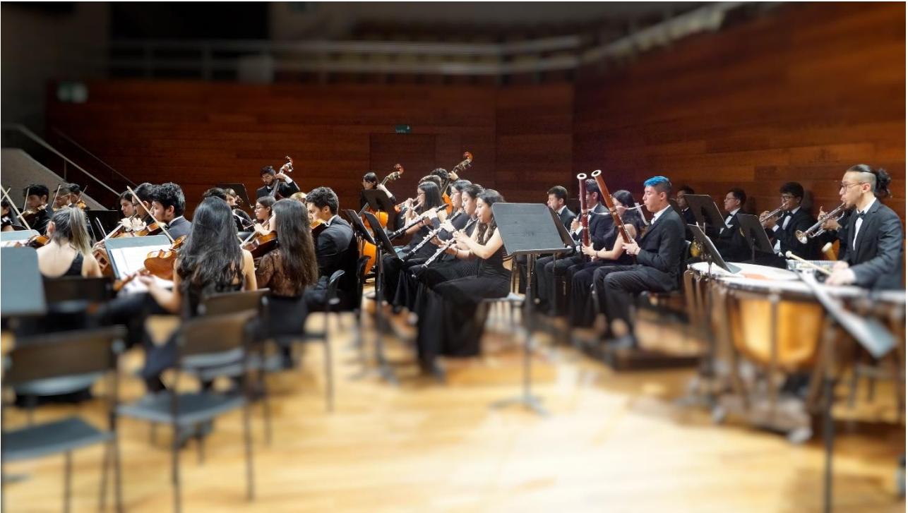
Ilustración 8 Concierto EL OIDO INTERNO Auditorio Fabio Lozano Septiembre 7 de 2019