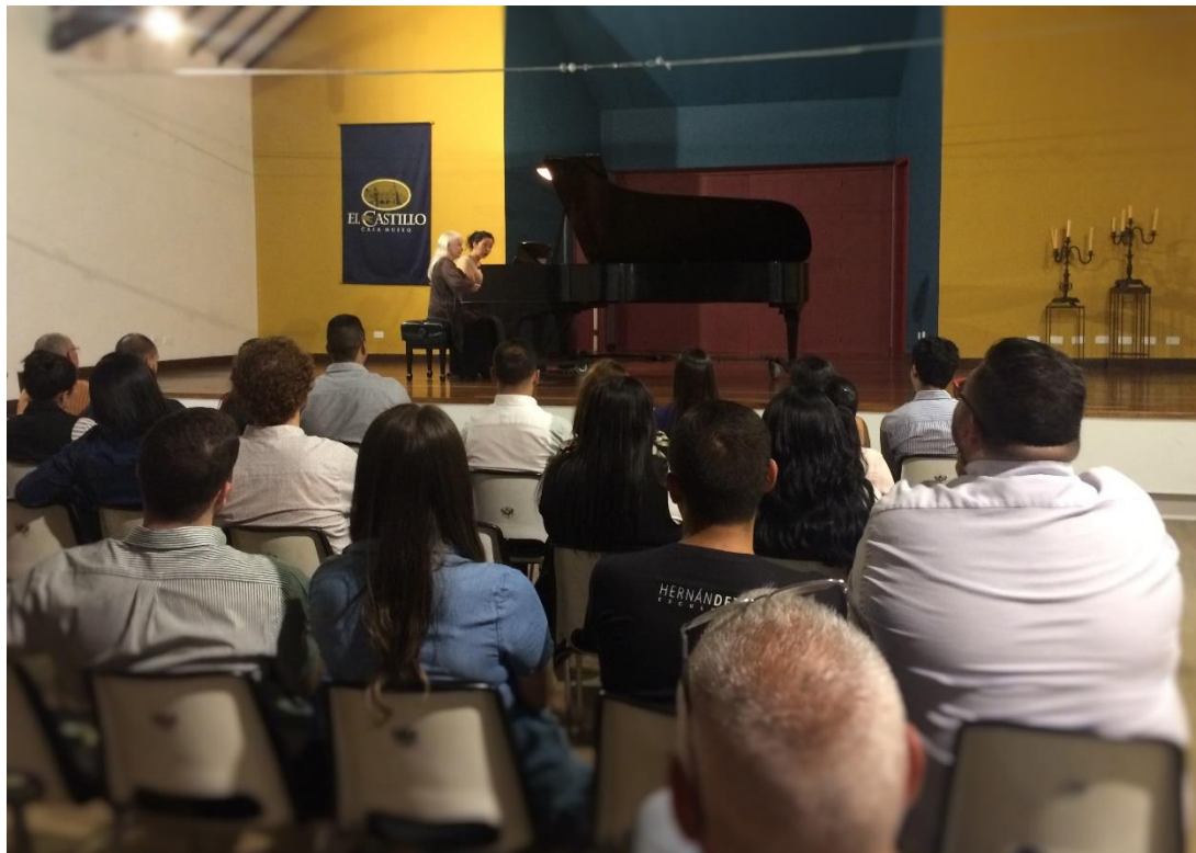
Ilustración 13 Concierto Sempre con Passione. Auditorio Museo El Castillo Medellín