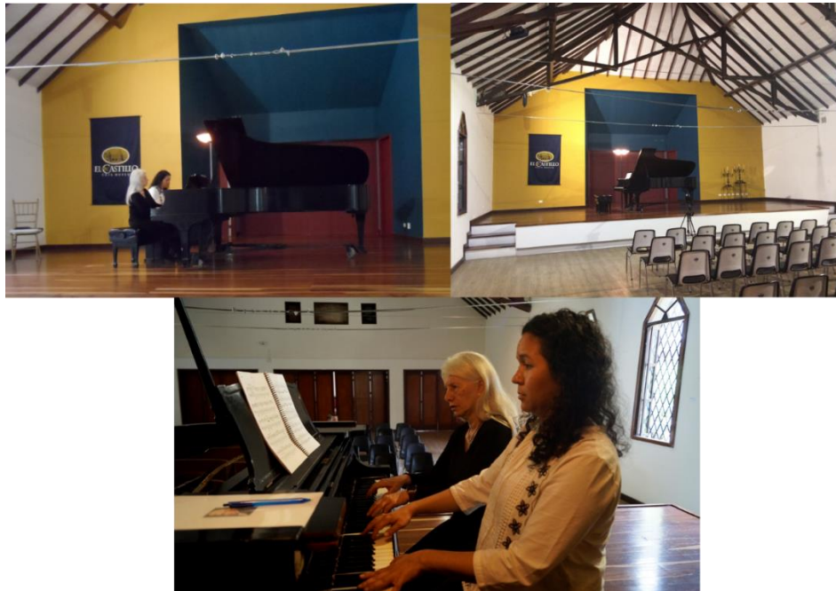
Ilustración 12 Ensayo previo al Concierto Sempre con Passione. Auditorio Museo El Castillo Medellín

Se realizaron las gestiones logísticas y de contacto, con la Sala de Conciertos del Museo el Castillo en Medellín, para la realización del programa de concierto SEMPRE CON PASSIONE, que incluyó una variación con respecto a la propuesta presentada en Bogotá, dos disciplinas artísticas: música y narración (ver ilustraciones 12, 13 y 14).