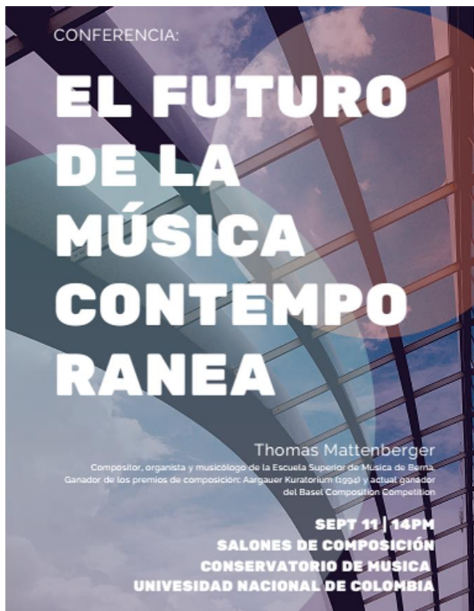
b. Afiche Conferencia para Compositores