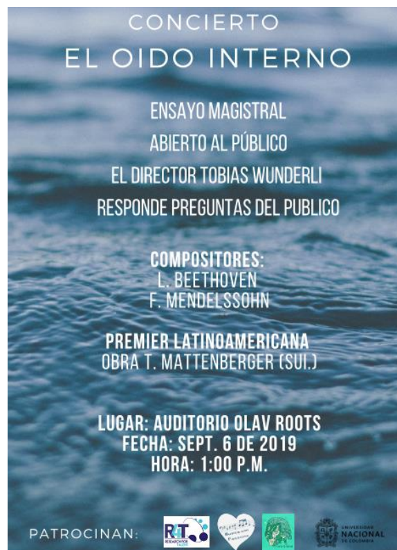
Ilustración 6 Afiche invitación al Ensayo abierto al público.