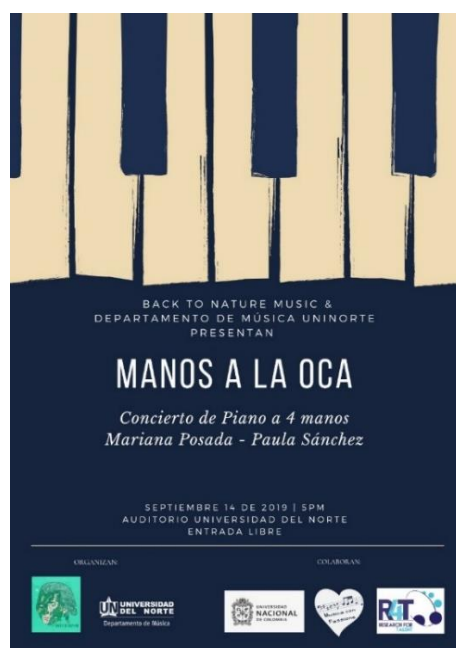
Ilustración 15 Afiche promocional del Conciertos.