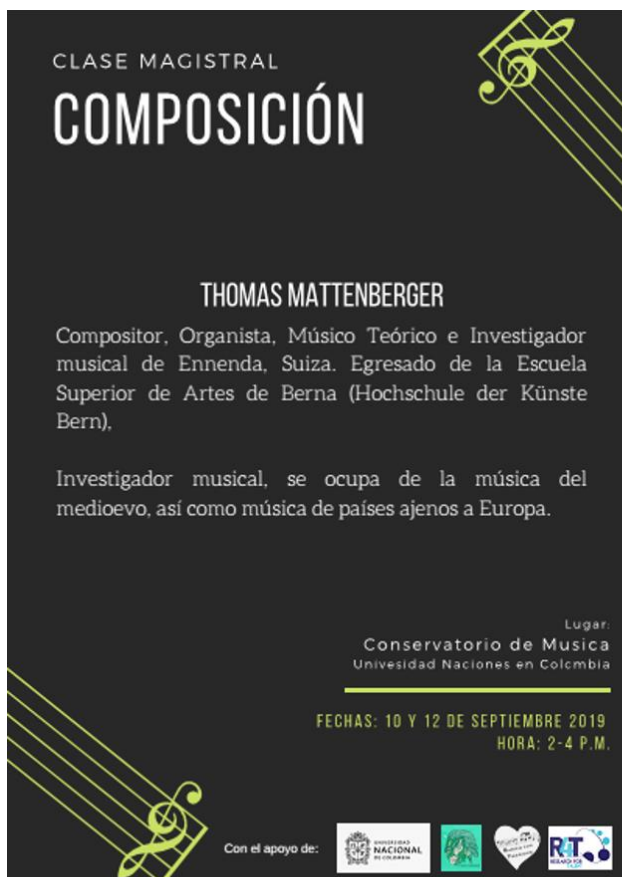
a. Afiche Clases Magistrales para Compositores

En el marco del proyecto, que incluía un programa de música contemporánea, se invitó al compositor suizo Thomas Mattenberger, ganador de los premios de composición: Aargauer Kuratorium (1994) y actual ganador del Basel Composition Competition (2018), a impartir dos clases magistrales y una conferencia (ver ilustración 9) teniendo como sede la Universidad Nacional de Colombia, pero como actividades abiertas a los estudiantes de composición de la ciudad.