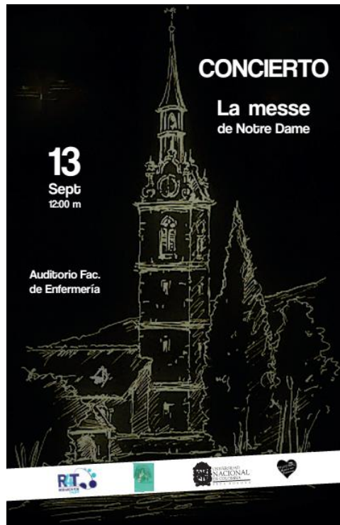
Ilustración 4 Afiche del concierto Auditorio Facultad de Enfermería Afiche: BACK TO NATURE - MUSICA CON PASSIONE