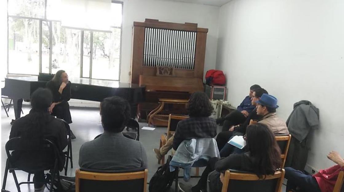
Ilustración 10 Fotos clases magistrales para compositores por T. Mattenberger