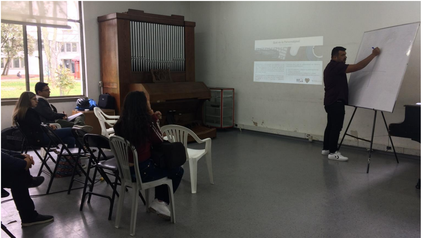
Ilustración 17 Taller 1. Sesión 1. Realizado por R4T en el conservatorio de música de la Universidad Nacional de Colombia