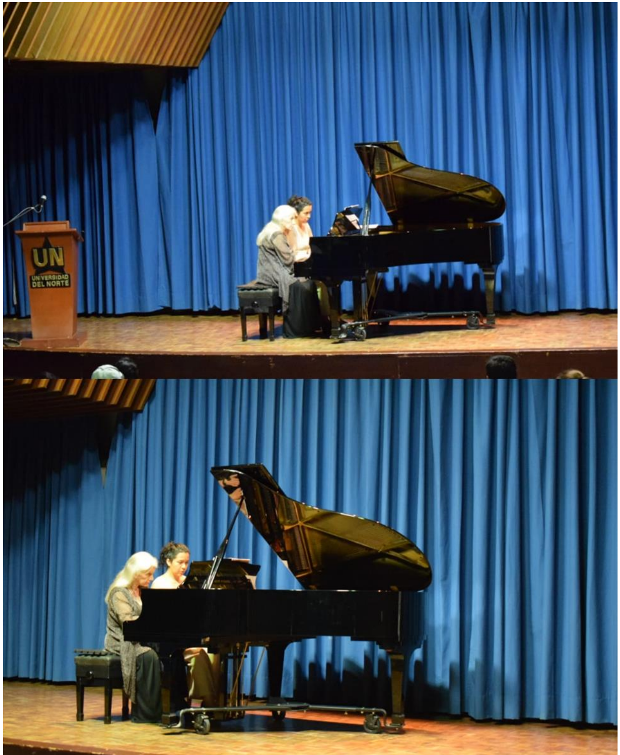
Ilustración 16 Concierto Manos a la Oca . Auditorio Universidad del Norte – Barranquilla (Col)