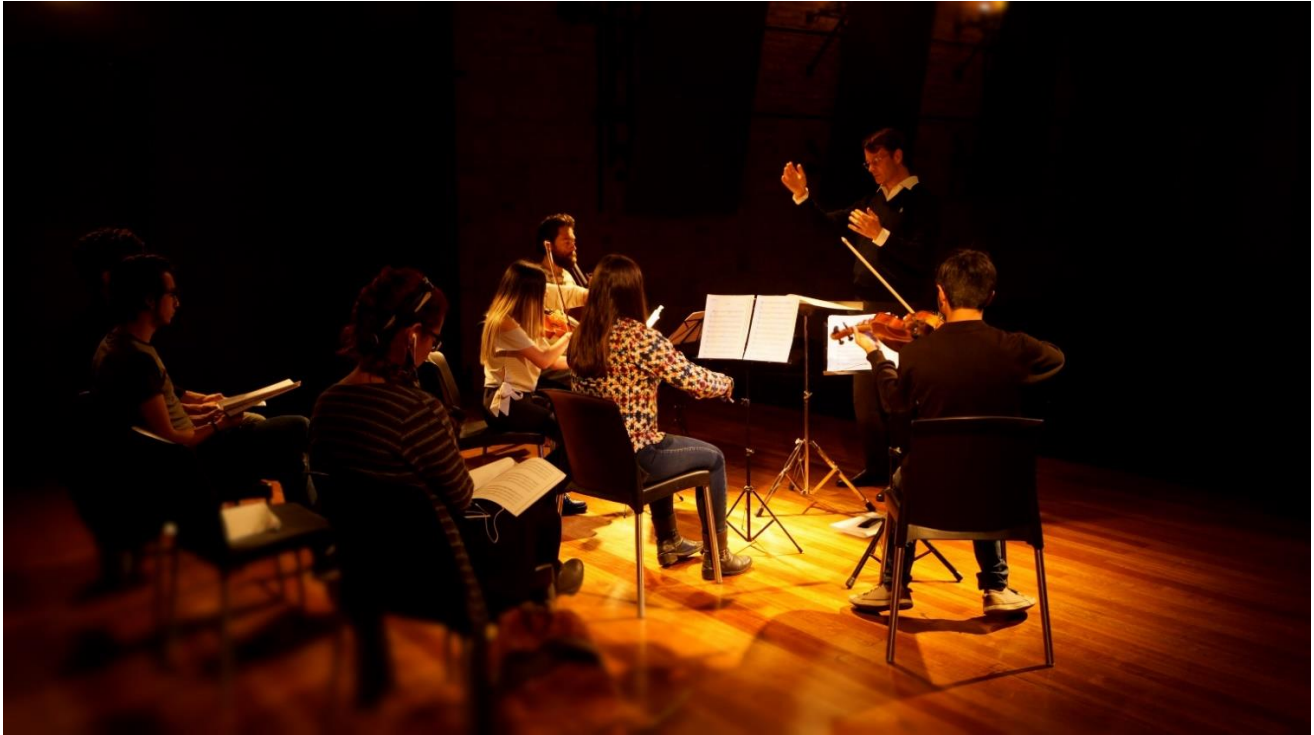
Ilustración 1 Ensayo Auditorio Teresa Cuervo Borda. Enero 2019.

Realizaron 5 ensayos previos al concierto (Ilustración 1), durante los cuales se trabajó con los músicos información sobre la época, los dos compositores y el enfoque que el director suizo quiso darle a la obra.