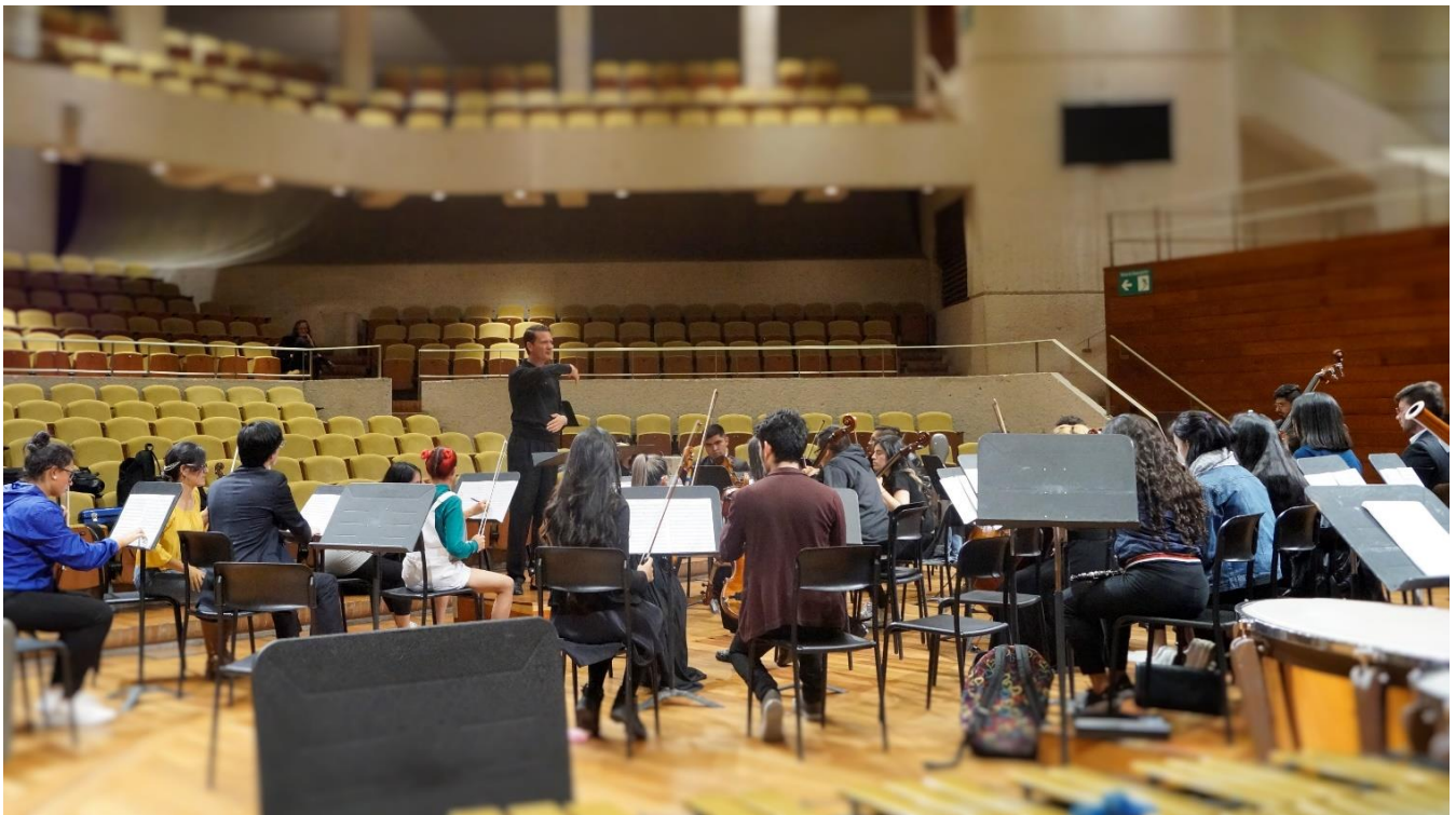
Ilustración 7 Ensayo General previo al Concierto Auditorio Fabio Lozano. Septiembre 1 de 2019.

Se inscribieron 75 músicos, de los cuales participaron efectivamente en el proyecto 54 personas, estudiantes de pregrado en música y egresados de diferentes universidades de la ciudad: Universidad Nacional de Colombia (22), Universidad Sergio Arboleda (5), Universidad Pedagógica Nacional (1) en ASAB Universidad Distrital (1) de otras instituciones (24).